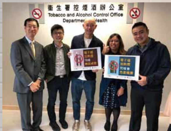
圖：東華三院戒煙綜合服務中心代表出席聯合記者會。

新型煙草產品近年成為城中熱話，對於這些產品的好與壞，坊間充斥着不少似是而非的說法，包括「幫助戒煙」、「無咁有害」、「煙仔替代品」等。有見及此，衛生署控煙酒辦公室與東華三院戒煙綜合服務中心及香港大學舉辦了聯合記者會，藉此 破解 大家對 電子煙、加熱煙 的迷思。