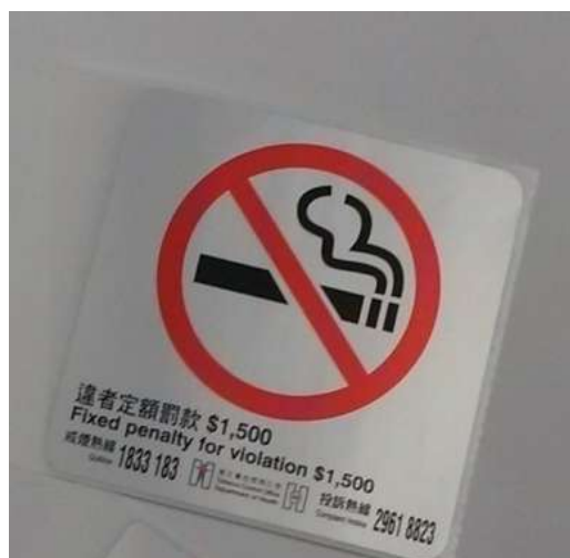
D1 禁煙標誌 8 x 8 厘米 (銀色)