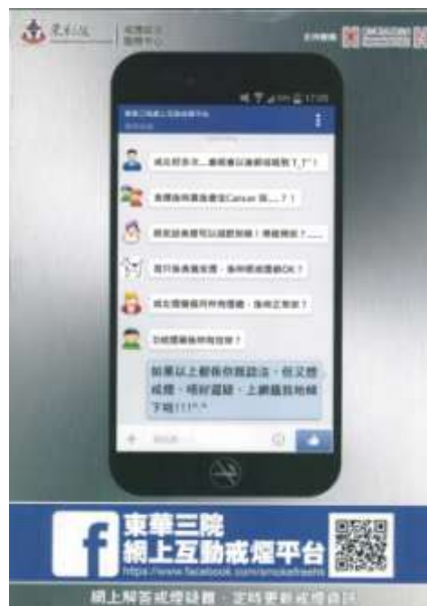
B2 海報: 東華三院 網上戒煙平台(A3 size)