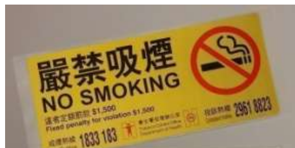
D5 嚴禁吸煙 18cm x 8cm (金色)