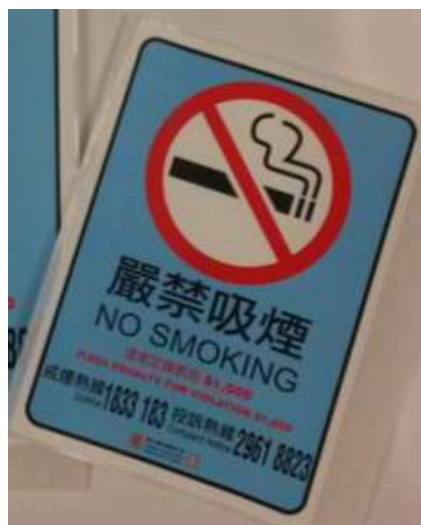
D2 嚴禁吸煙 定額罰款$1,500 10 x 14 厘米 (淺藍色)