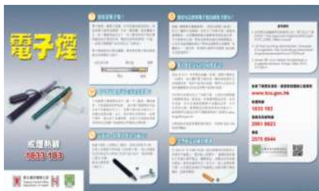
C6 海報: 電子煙小冊子