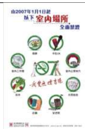
C2 海報: 室內場所全面禁煙 (A2 size)