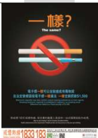
C3 海報: 不要吸煙和電子煙 (A2 size)