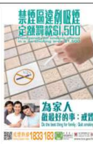
C4 海報: 為家人做最好的事:戒煙 (A2 size)