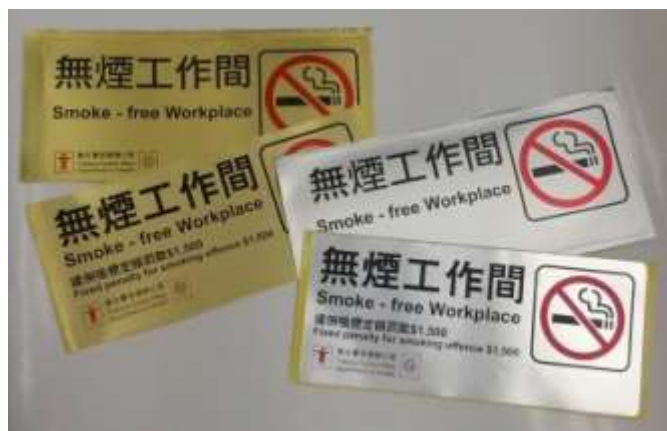
D3 無煙工作間 20 x 9 厘米 (金色)