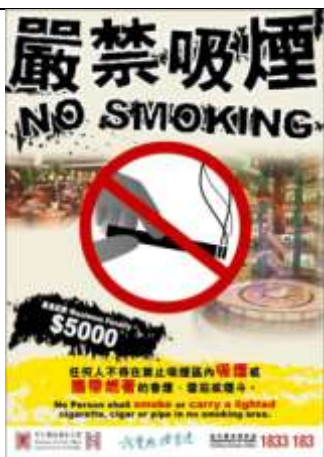
C1 海報: 嚴禁吸煙(商場和食肆用) (A2 size)