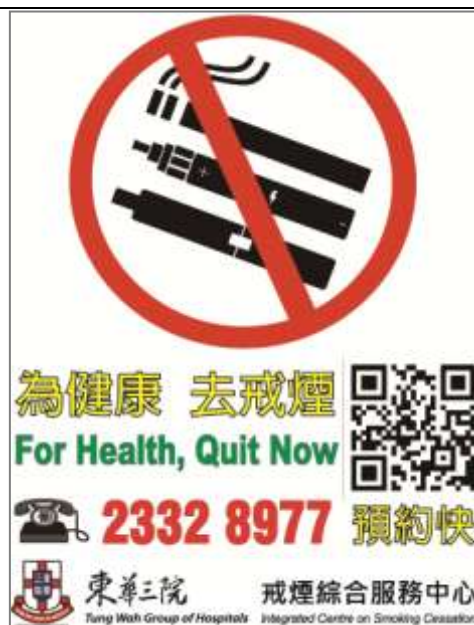
B3 靜電貼 (一包共有兩款, 可貼於玻璃或光滑平面) (每張 12cm x 16 cm)