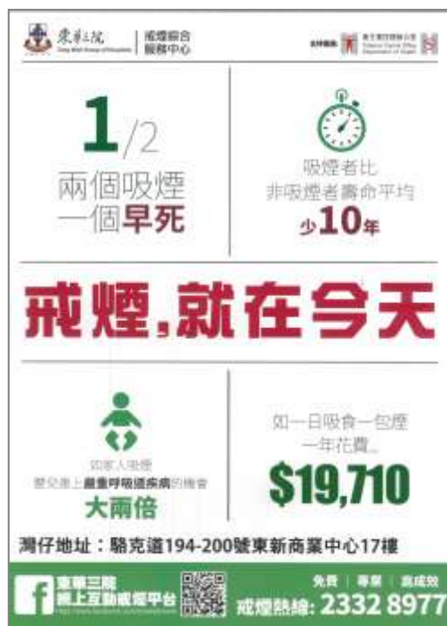
B1 海報: 戒煙, 就在今天 (A3 size)