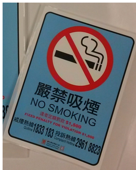
D2 嚴禁吸煙 定額罰款$1,500 10 x 14 厘米 淺藍色