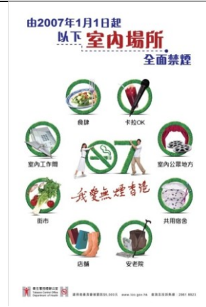
B2 室內場所全面禁煙 (A2 size)