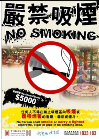
B1 嚴禁吸煙，商場和食肆專用 (A2 size)