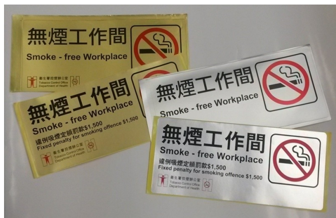
D3 無煙工作間 20 x 9 厘米 金色 D4 無煙工作間 20 x 9 厘米 銀色