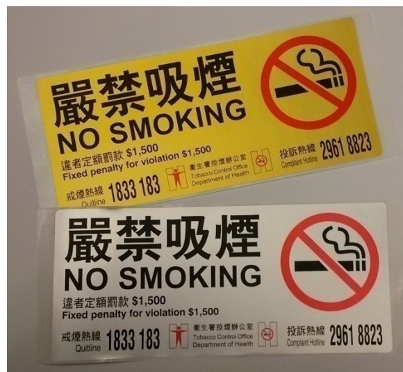
D5 嚴禁吸煙 18cm x 8cm 金色