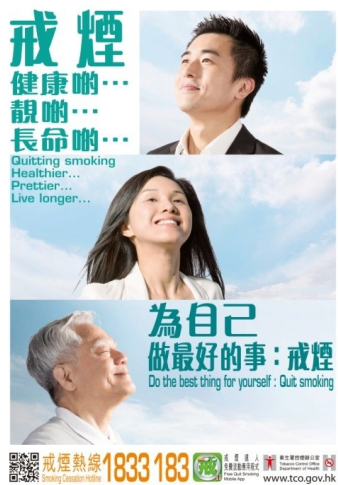
B5 為自己做最好的事:戒煙 (A2 size)