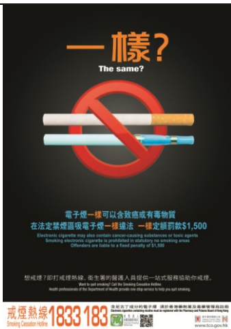
B3 不要吸煙和電子煙 (A2 size)