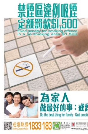
B4 為家人做最好的事:戒煙 (A2 size)