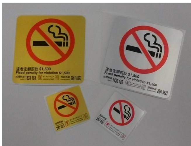
D1 禁煙標誌 8 x 8 厘米 銀色