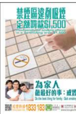
C4 海報: 為家人做最好的事: 戒煙 (A2 size)