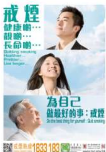
C5 海報: 為自己做最好的事: 戒煙 (A2 size)